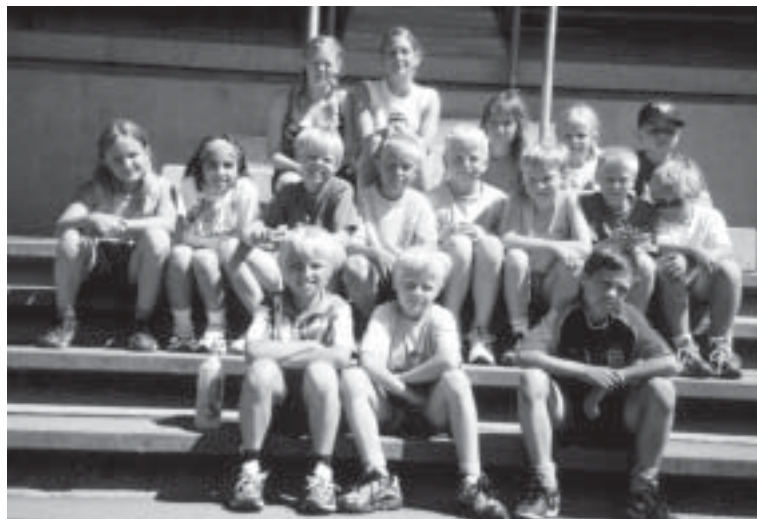
Några av årets barn på sommarfriidrottsskolan ur gruppen -92.

Från deltagare har sagts, att idrottsskolan var en av sommarens roligaste upplevelser.